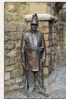
Schutter aan de Poort