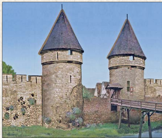
Reconstructie: Jac Diederer

Kijk op de website www.mergel.nu en www.heiligehuizenvalkenburg.nl voor meer culturele wandelingen.