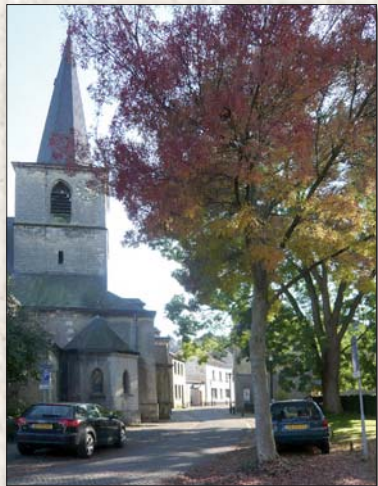
HH Nicolaas- en Barbarakerk

Hier is altijd een drenkplaats voor het vee geweest. Later is er een trap gebouwd. Dit is ook een van de plekken waar vroeger de was in de Geul gedaan werd. In de laatste boog van de stadsmuur bevindt zich een bronzen plaquette met de titel 'Historische Wasplaats'.