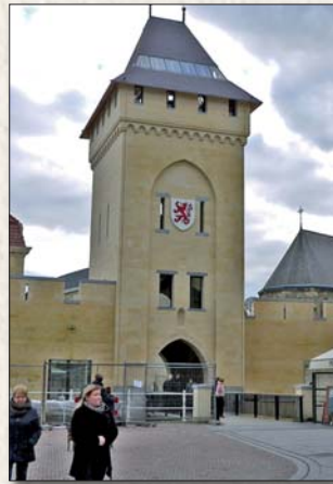
De herbouwde Geulpoort

Bij het balkon stond vroeger een muurtoren. Het 'Old Hickory' bruggetje is recent en ligt op de plek waar Amerikaanse soldaten in 1944 via ladders de Geul overstaken. De bruggen waren immers vernietigd.