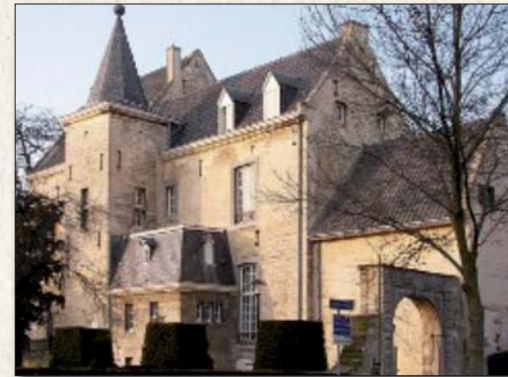
Kasteel Den Halder