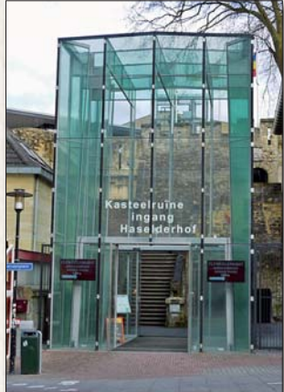
Glazen toegangspoort tot de Kasteelruïne

Neem de trap of lift naar boven. Vanaf het terras hebben we een mooi uitzicht over de vestigstad. De begrenzing liep van de Grendelpoort naar kasteel Den Halder, via de Geulpoort naar Hotel Walram (bruinrood met antennes op het dak) en van daar naar de Berkelpoort waarvan nog het spitse dak helemaal rechts is te zien. De bebouwing buiten de vestigstad stamt gedeeltelijk uit de 19de maar vooral uit de 20e eeuw.